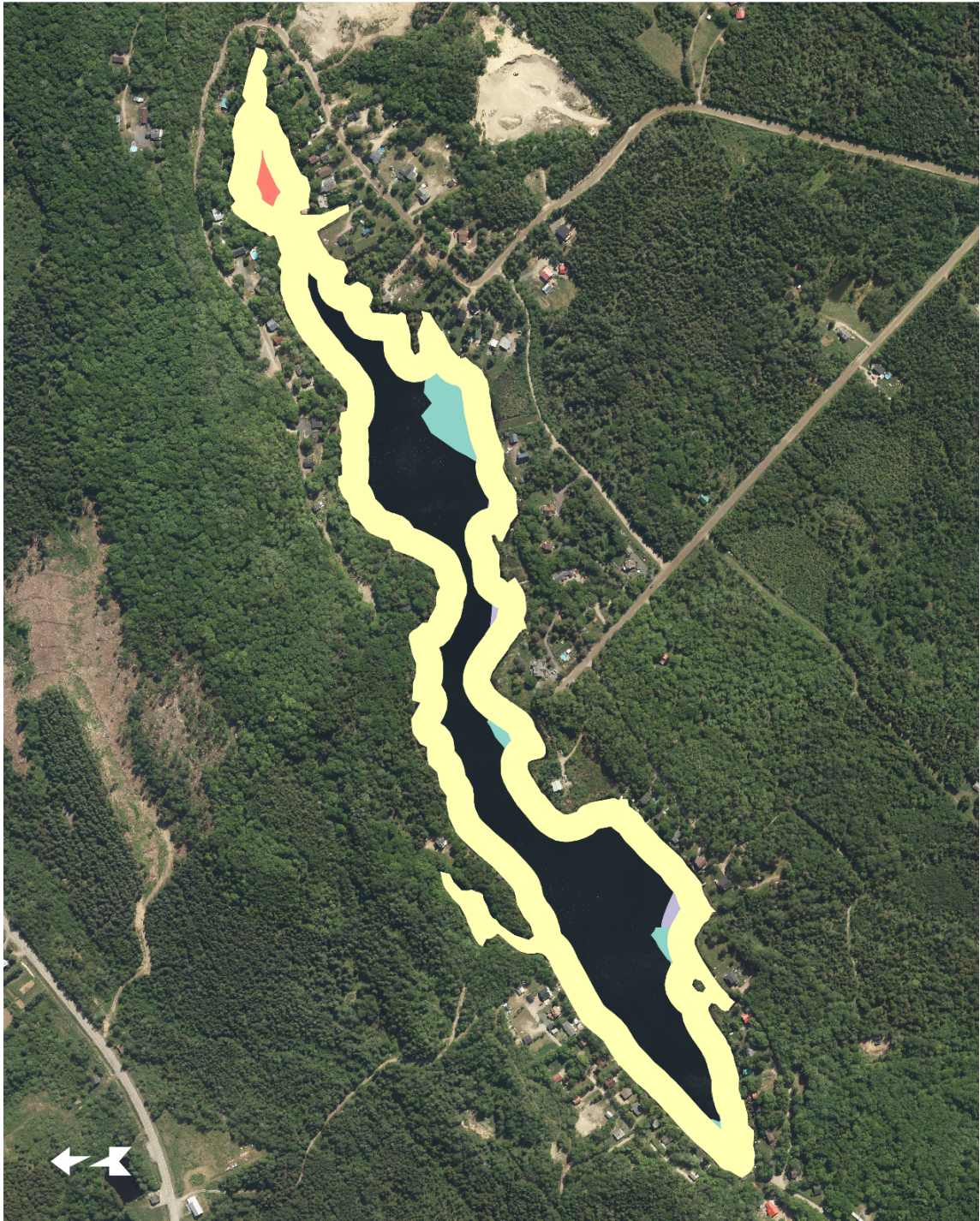
Figure 7. Contraintes à la navigation au lac Crève-Faim

Détermination de la capacité nautique du lac Crève-Faim